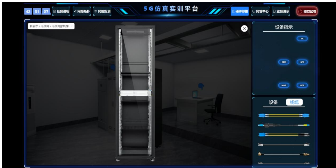
(3) ODF 架内部自带设备图